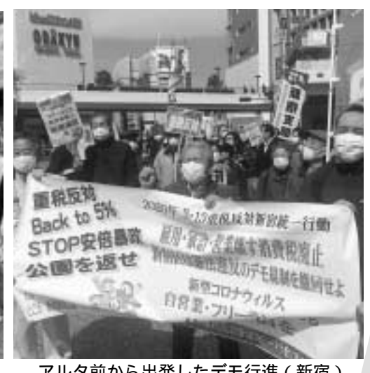
アルタ前から出発したデモ行進(新宿)